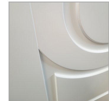
profil ramiaka skrzydła